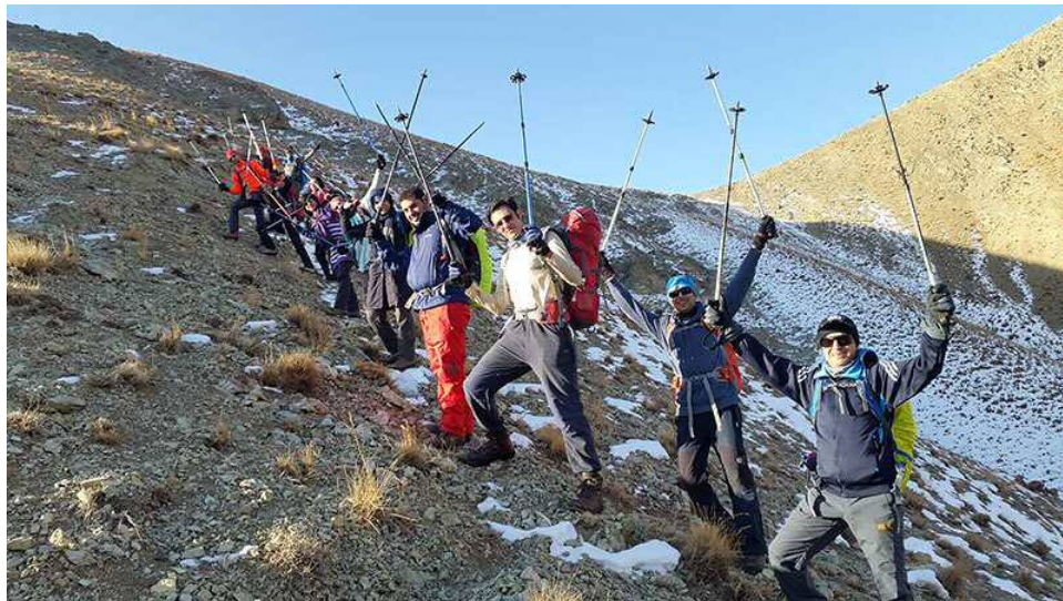
جنگل کارا به یال جنوب شرقی