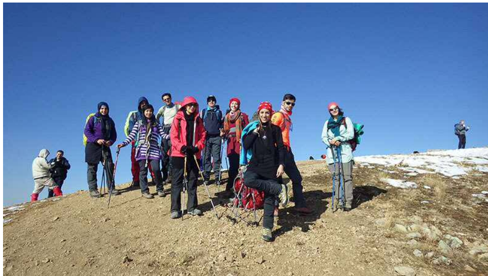
قله چین کلاغ